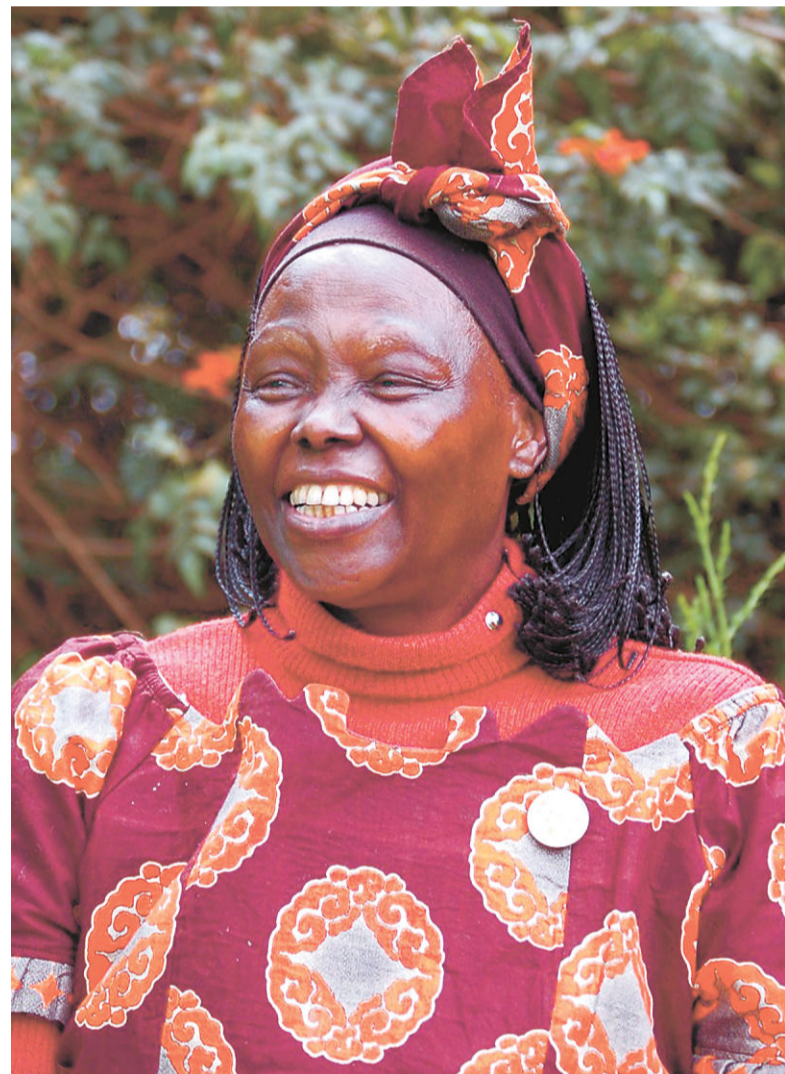
ワンガリ・マータイ氏 (2004年)