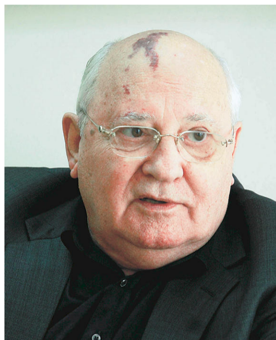
ゴルバチョフ旧ソ連大統領 (1990年)