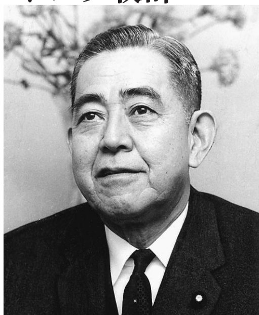
佐藤栄作元首相 (1974年)