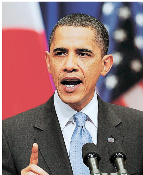
オバマ米大統領 (2009年)