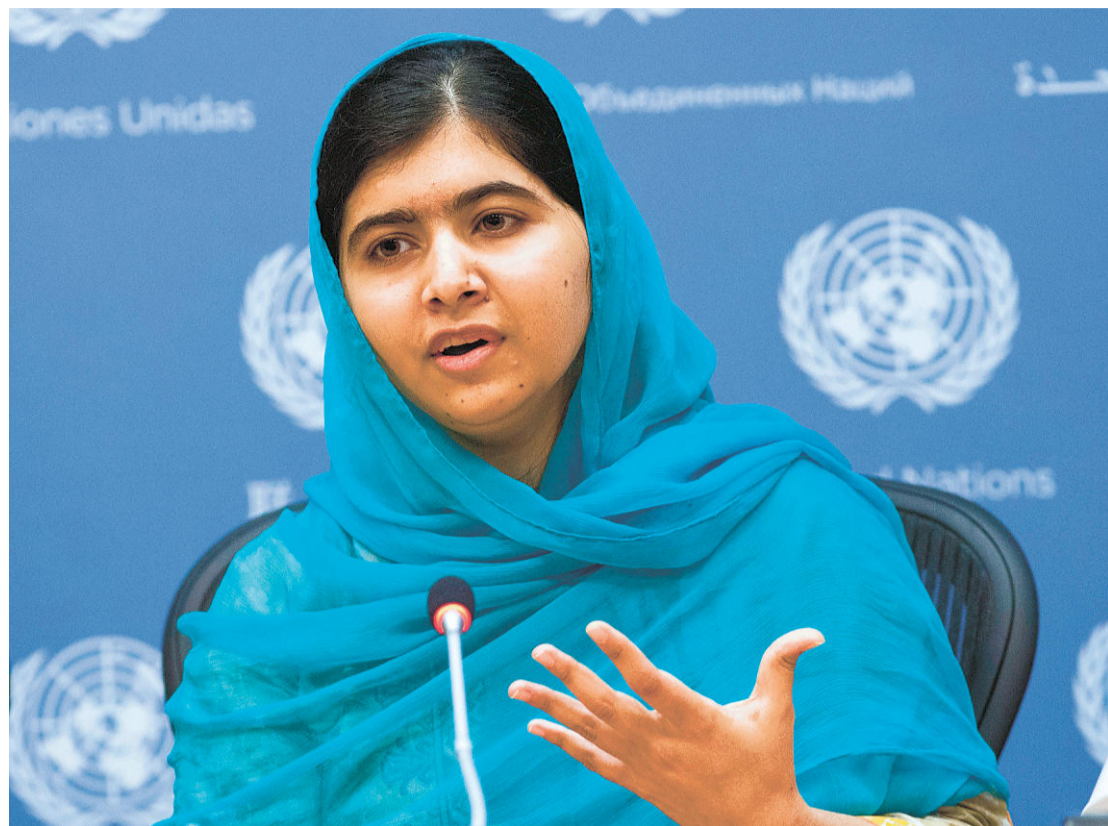
マララ・ユスフザイさん (2014年)