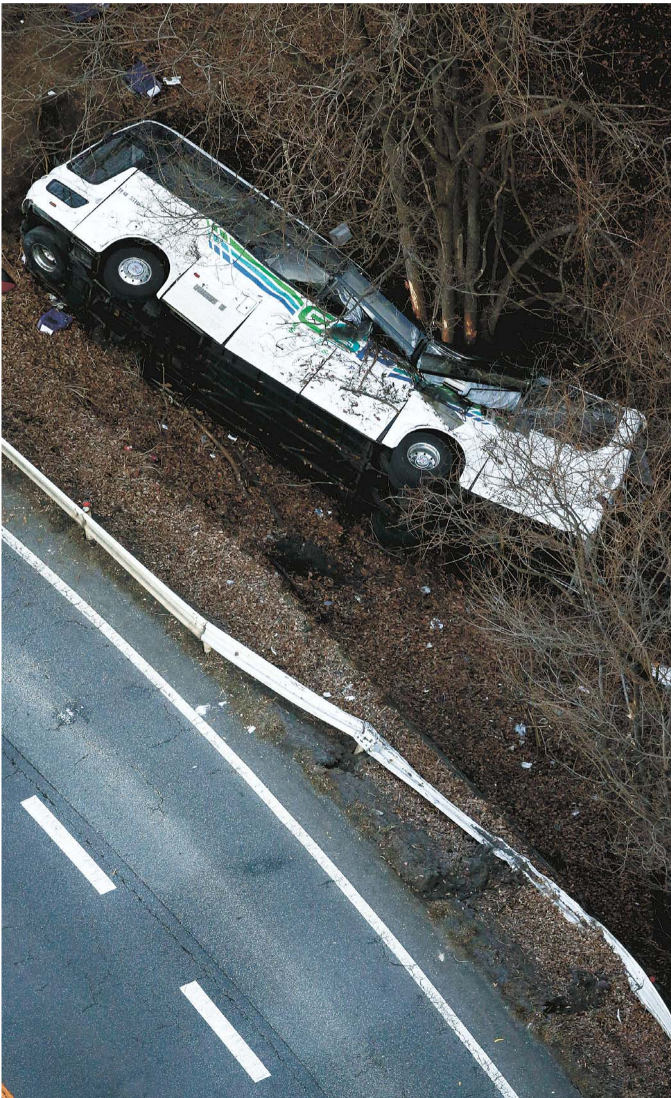
ガードレールを突き破り、道路脇に転落したスキーバス＝長野県軽井沢町で15日午前7時25分

15日午前2時ごろ、長野県軽井沢町の国道18号「碓氷バイパス」入山峠付近で、大型バスがセンターラインを越えて対向車線側のガードレールを突き破り、3以下に転落して山林内の立ち木に衝突した。県警軽井沢署によると、スキーツアーバスで客と乗員計41人が乗っていた。総務省消防庁によると午前8時現在、男女14人が死亡、27人がけがをした。病院9カ所