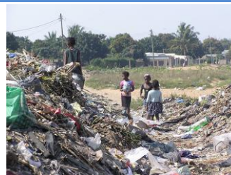
モザンビークの首都 マプトの郊外

よく晴れた日曜日の朝、ロンドンの住宅街で黒人青年の遺体が見つかりました。ロンドン五輪の興奮が冷めやらない2012年9月9日のことです。状況からアンゴラ発ロンドン行き旅客機の脚部付近から転落したと断定されました。男性はモザンビーク国籍の26歳の男性でした。何のために命がけの渡航を試みたのか――。それまでの人生の軌跡をたどると、豊かさと愛する人への思いを秘めながら、現実の厳しさと息苦しさにはね返さる青年の姿が浮かびあがってきました。それはまた、おしなべて貧困、政情不安にあえぐアフリカの若者たちが心の奥底に抱えている葛藤でした。