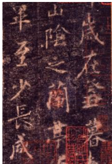
「定武蘭亭序—許彦先本—」部分、王羲之筆、原跡：東晋時代・永和9年(353) 東京国立博物館蔵

◇300組 600名様 ご招待 4世紀の中国・東晋時代に活躍し、「書聖」とあがめられた王羲之(おうぎし)の実像に迫る、特別展「書聖 王羲之」(主催：東京国立博物館、毎日新聞社、NHKなど)が、1月22日から東京国立博物館で開催されます。まいまいクラブでは、本展の「特別鑑賞会」を2月14日(木)に開き、会員300組600名様をご招待します。