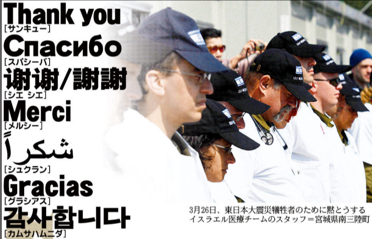
3月26日、東日本大震災犠牲者のために黙とうするイスラエル医療チームのスタッフ=宮城県南三陸町

はげましを忘れない 大きな余震が続き、震災被災者たちの苦悩は、いつ終わるかどうかも予測がつかない。再び活力あふれる日本社会が戻ってくるまでには、もう少し時間がかかるだろう。だが私たちは、強じんて魅力ある国として、必ず復活する。国際社会から温かいエールに応えるために、世界中からまた、たくさんの人がやっ