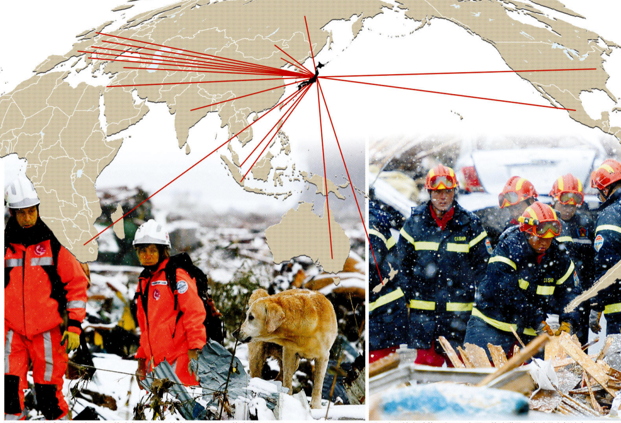
3月16日、宮城県南三陸町で、救助犬を連れて捜索するスイスの救助隊 雪中、捜索活動に当たる中国の救助職員=岩手県大船渡市で3月16日 ※4/14現在 外務省資料から。旗はオリンピックで使用されるもの