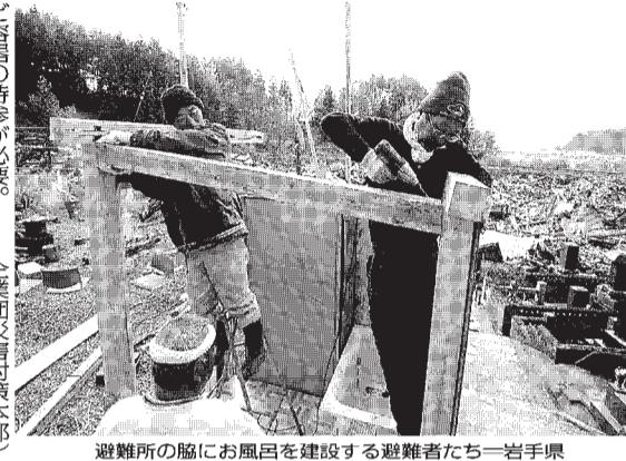
避難所の脇にお風呂を建設する避難者たち一岩手県大槌町の徳院で29日