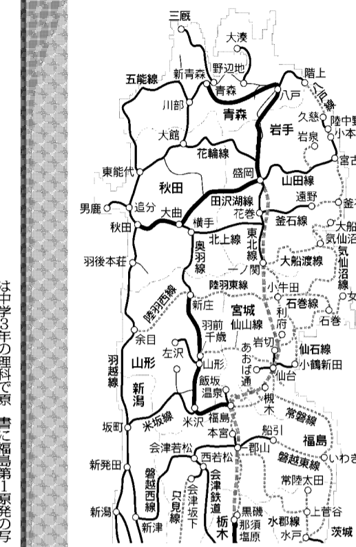
◆主な鉄道の運行状況◆ ※31日予定含む

来春から中学生が使う教科書の検定結果が30日公表された。中学教科書各社とも多めに震災や原発に関する内容を盛り込んでいる。11日に発生した東日本大震災の被災地や、被災者の苦悩を伝える内容も目立つ。教科書各社は、震災や原発の影響が長期化するなか、今年度の検定結果をめぐり、内容の整理や、教科書の見直しに苦慮している。【乾達】